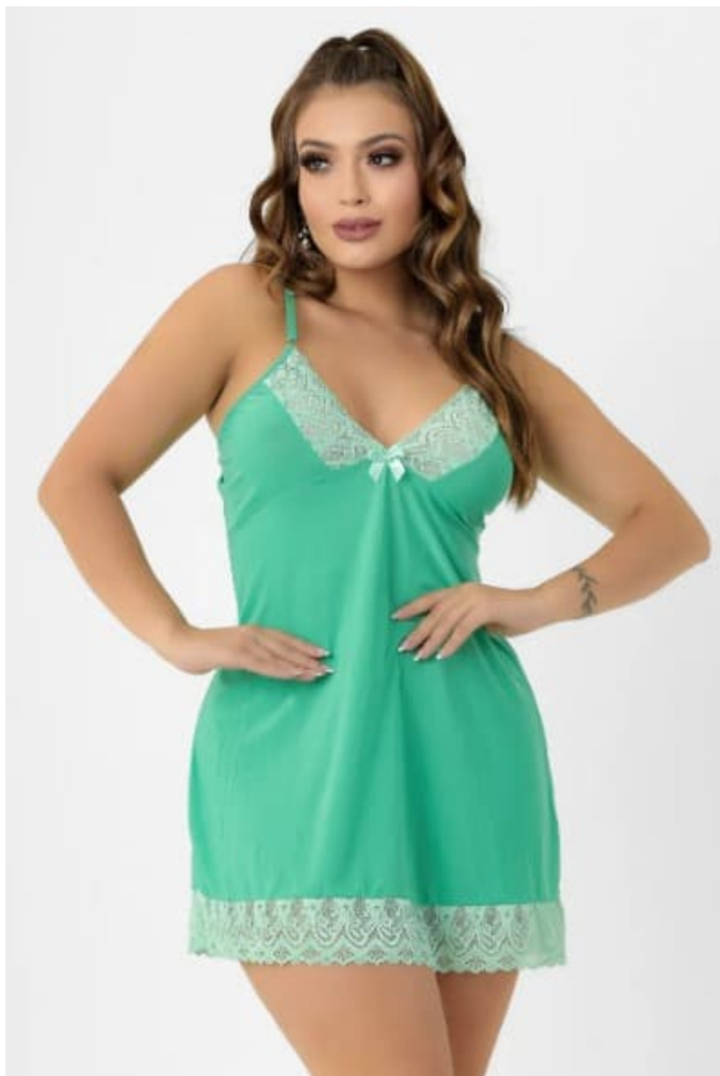
Camisola Feminina Seda