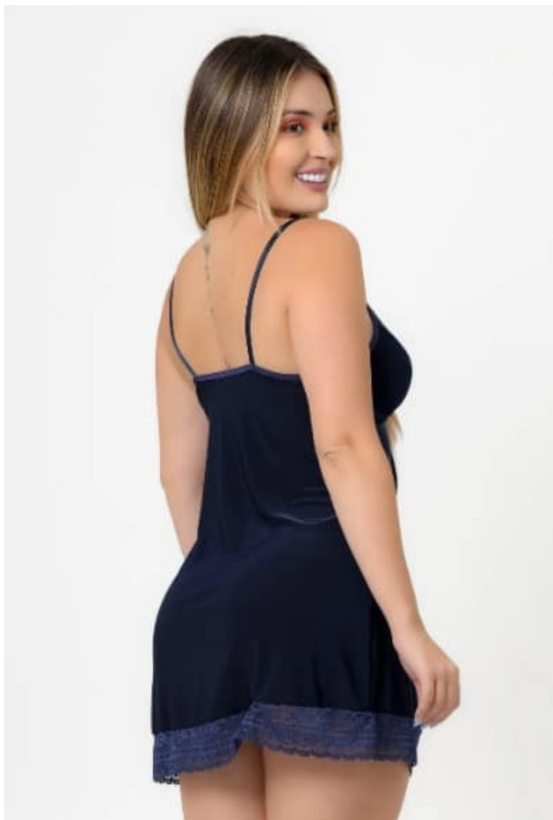
Camisola Feminina Algodão