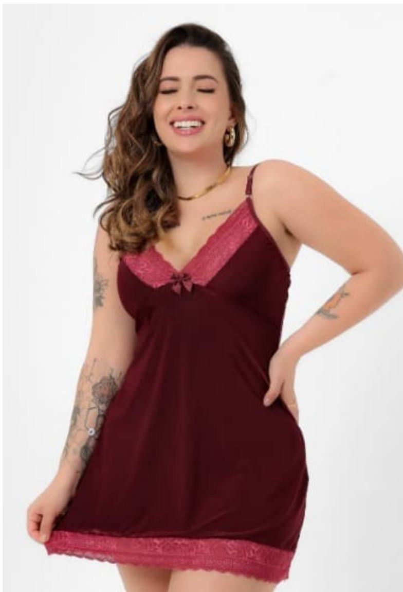
Camisola Feminina Sexy